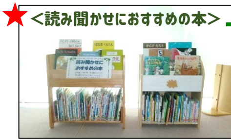
★ <読み聞かせにおすすめの本>

1階こども図書館の「のりもの絵本」コーナーと「読み聞かせにおすすめの本」コーナーをキッズルームに移動しました。新しい排架場所は下記の館内図のとおりです。場所の詳細は1階カウンターの職員までお尋ねください。