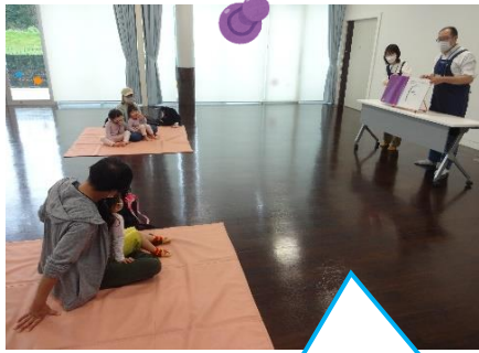
大型絵本も読みました！

3月27日（日）におはなし会スペシャルを開催しました。 いつもより長めのおはなしや、男女共同参画についてのわかりやすいおはなしに、子どもたちも耳を傾けていました。 読み聞かせの後には紙コップを使ったけん玉づくりをして、みんなで楽しく遊びました。ご参加くださった皆さん、ありがとうございました！