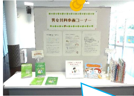
男女共同参画コーナーもありました