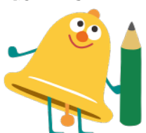
シラベルくん コンクールキャラクター ©図書館振興財団

調べる学習とは身近な疑問やふしぎに思うことなど、テーマを自由に決めてそれについて調べていくことだよ！まずは自分の好きなものからテーマを決めてみよう！