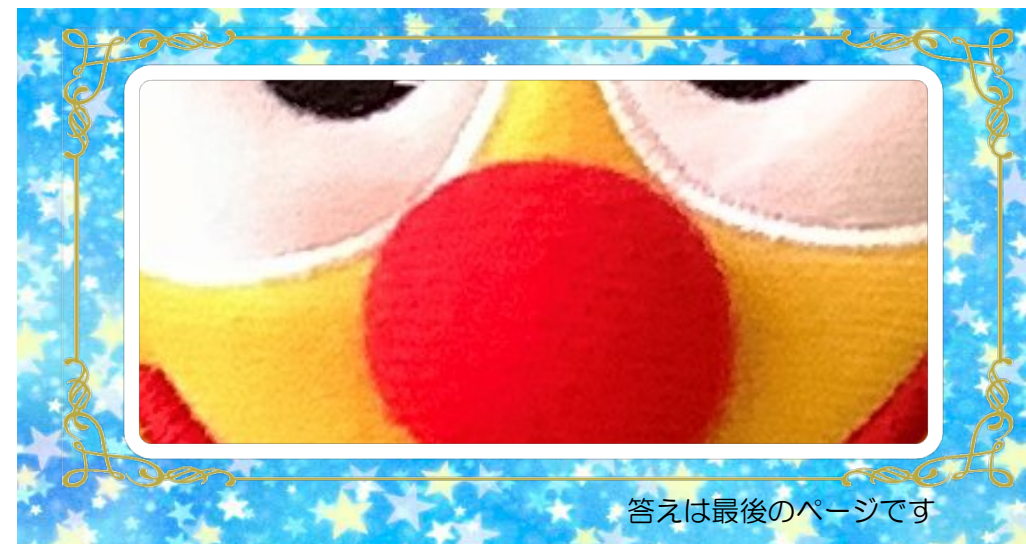
答えは最後のページです

右の写真は図書館に期間限定で登場するあるものを近くでさつえいした写真です。さてこれは何かな?