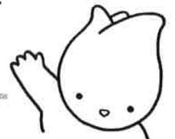
はくもくれんちゃん

研修室、ホール、展示ホールも 9:30からご利用が可能です。 既にご予約済で変更などされたい方は 事前にお問い合わせ下さい。