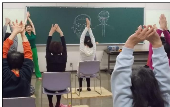
3月17日「ヨガ体験でリフレッシュ」