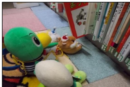
10月13日 ぬいぐるみのお泊まり会