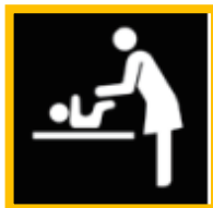
おむつをかえる台