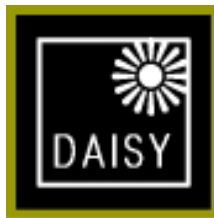
パソコンでよめる本 ほん