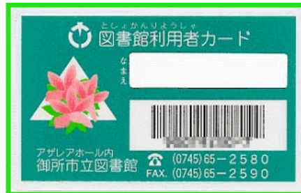
りようしゃかーど 利用者カード

② 利用者カード と 借りたい本 を図書館の人に 見 せます。 りようしゃかーど か ほん としょかん ひと み